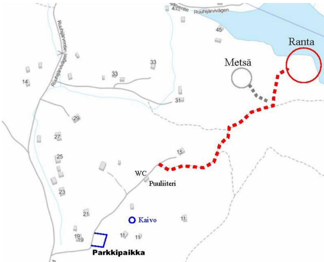
Kuva yllä – lähikartta

Ruuhijärventie on kapea ja partiolaisten alaparkkipaikalle ei mahdu kuin muutama auto kääntymään. Saapukaa paikalle porrastetusti tai pyytäkää vanhempia jättämään lapset Ruuhijärventien alkupäähän. Naapurien pihalle ei saa parkkeerata tai siellä kääntää autoja!