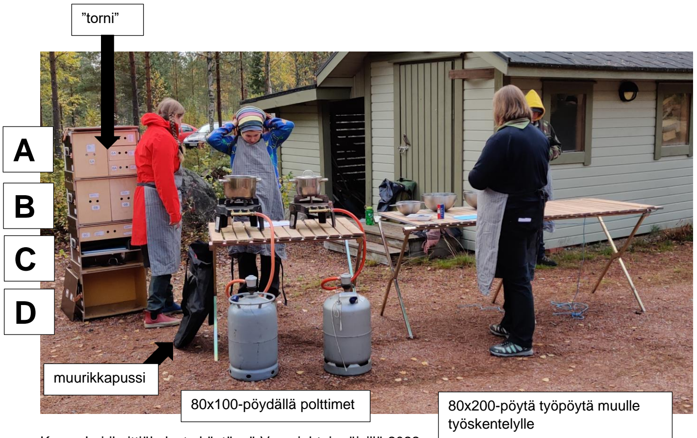
Kuva Leirikeittiökäkalusto käytössä Versojohtajapäivillä 2022

PUUTTUU: vesikanisterit, LAJITTELUROSKIKSET, BIOÄMPÄRI, kylmälaukku, kuivavarastolaatikat, palopeite,