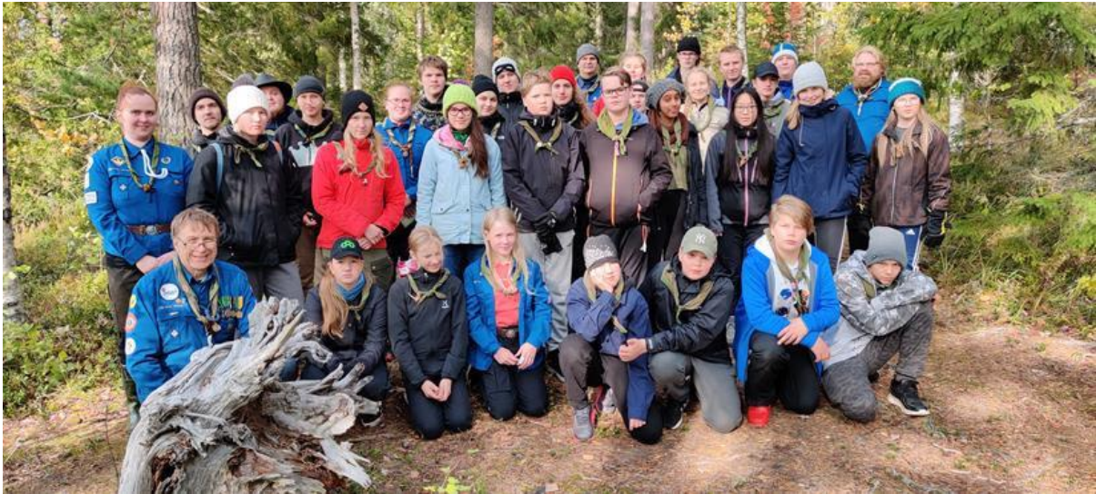
Edellisen Verso-ROKin (2020 syyskuu) osallistujia ja järjestäjät

Vuonna 2021 ei onnistuttu pitämään Veros-ROKkia kahdesta hyvästä yrityksestä huolimatta. Nyt 2022 koulutus pyritään järjestämään mikäli vain se on mahdollista - vaikka kahdessa "kuplassa".