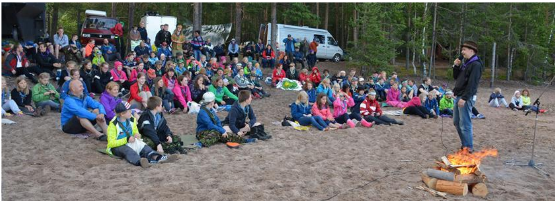
Helpeen helistäjä pidettiin 2015 Saimaan rannalla Hepohiekassa

Versokäräjillä keskustellaan sopivasta leiripaikasta seuraavalle versoleirille, joka pidetään kesällä 2023. Leiriministerin johdolla partiotoimikunta tuo versokäräjille ehdolle kolme leirialuevaihtoehtoa: