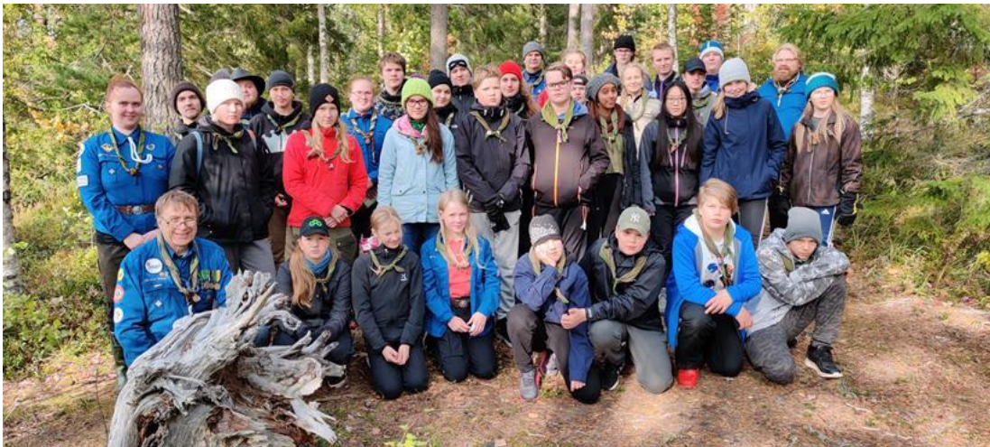
Kuvassa vuoden 2020 Verso-rok'in osallistujat ja järjestäjät

ILMOITTAUTUMINEN VERSO-ROKILLE ON AUKI SU 15.8.2021 ASTI!