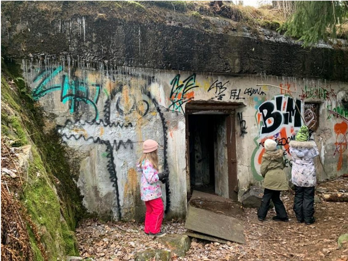
Kuva: Rastiradalla pääsi tutustumaan hyvin säilyneisiin sodan aikaisiin kalliosuojahuoneisiin

yllättäen nopeilla suunnistajilla onkin ollut eniten ongelmia maltaa odotella paikannuksen päivittymistä ja on juostu rastien ohi! Myös pienimpien osallistujien kanssa on tullut ilmi, ettei vanhempien puhelinta uskalleta antaa lapsen käsiin, jolloin lapsen suunnistukseen osallistuminen ei onnistukaan häneltä.