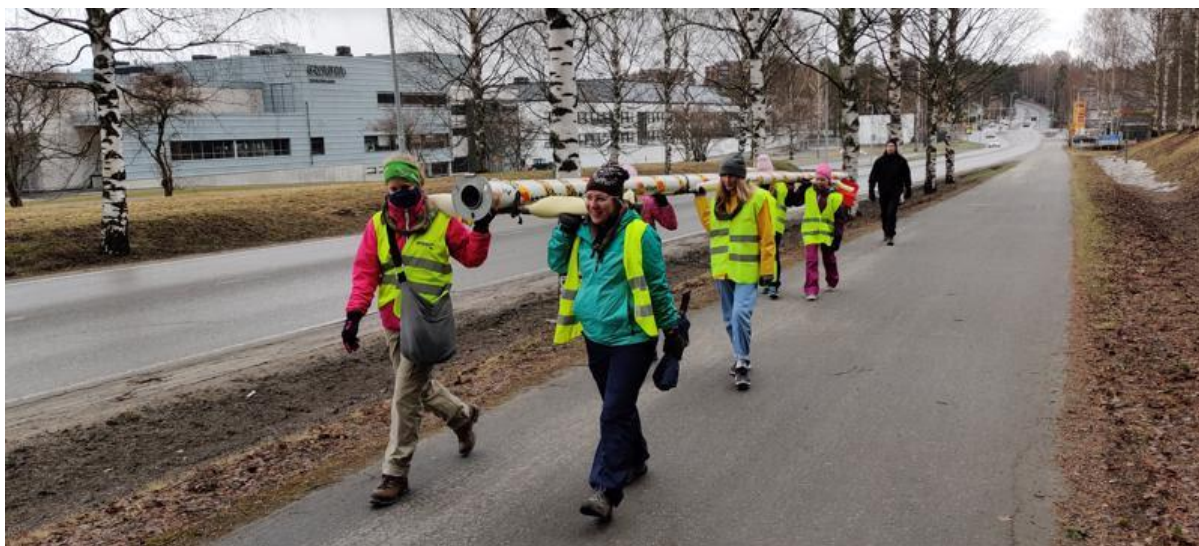
Kuva: Seikkailijajoukkue Ryhävalaat vuorollaan kantamassa lipputankoa

Jyväskylän Versojen kaiku-kämpä vihittiin viisi vuotta sitten eikä pihapiirissä ole ollut lipputankoa. Viime vuoden kärrysaunaprojektissa varattiin rahaa myös uuteen lipputankoon ja niinpä partioviikolle haastettiin kaikki lippukunnan ryhmät kantamaan yhdeksän metriä pitkää lipputankoa 19,6 km matkan rautakaupasta kämpälle. Kahdeksan